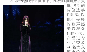
在第一轮的分组演唱中,晋级第二轮决赛。

(通讯员/刘欣林)为培养发展当代大学生综合素质,丰富同学们的课余时间,为同学们提供一个展示自我,展现魅力的平台,发掘优秀的“电信之声”,我院特此举办“聚芯盟全,襄我心声”K 歌大赛。在历经初赛赛后,十名成功晋级的选手于 3 月 23 日登上大礼堂的决赛舞台。